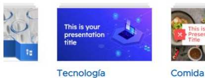
Fig. 4: Categoría de presentaciones de Tecnología

Al entrar a la categoría de tecnología encontramos múltiples opciones y al visualizarlas en la misma página, nos agrada la siguiente, por lo que procedemos a descargarla, Figura 5.