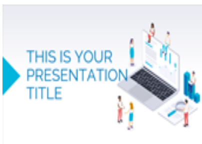
Fig. 5: Plantilla elegida para hacer una presentación sobre Tecnología Digital.

Al entrar a la categoría de tecnología encontramos múltiples opciones y al visualizarlas en la misma página, nos agrada la siguiente, por lo que procedemos a descargarla, Figura 5.