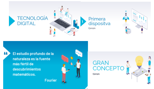
Fig. 6: Ejemplo de dispositivas completas.

Una vez que descargas la plantilla, puedes comenzar a editarla desde la portada, seleccionando las dispositivos funcionales de acuerdo con la información que se colocará; se puede hacer uso de los íconos y emoticones que están al final de la plantilla, Figura 6. En la medida de lo posible debe respetarse al diseño, forma y color de los elementos gráficos de la plantilla.