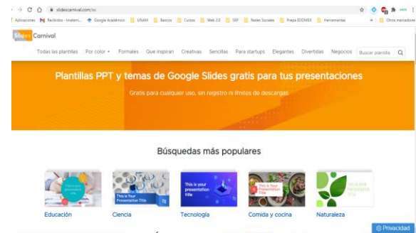
Fig. 1: Pantalla principal de Slides Carnival.

Cuando ingreses al sitio oficial, la primera pantalla que observarás es como la Figura 1.