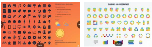
Fig. 3: Ejemplos de íconos disponibles al final de cada plantilla.

Algo llamativo en todas las plantillas es que al final de cada una, se coloca una colección amplia de íconos de todos los temas que complementan la construcción de las diapositivas y en general de toda la presentación, Figura 3.