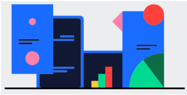
Fig. 3: Hacer un seguimiento.

Una vez terminada tu presentación de Mentimeter, la puedes compartir y exportar los resultados para hacer un análisis más detallado e incluso comparar los datos a lo largo del curso para medir el progreso de los alumnos.