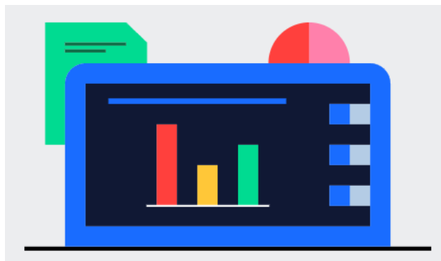
Fig. 1: Preparar.

Como dirigente de la sesión, te toca preparar el contenido : las preguntas y sus posibles respuestas, crear un código para votar e indicar a los participantes cuándo participar.