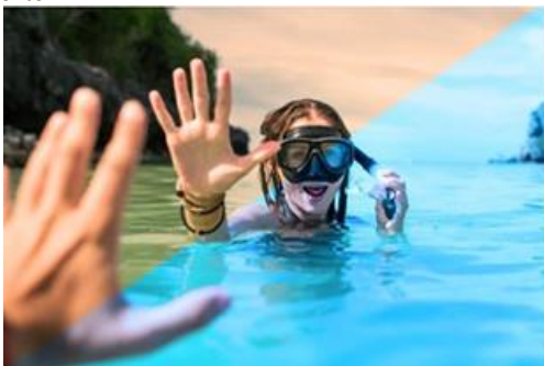
Fig. 4: Añade efectos y filtros con facilidad.