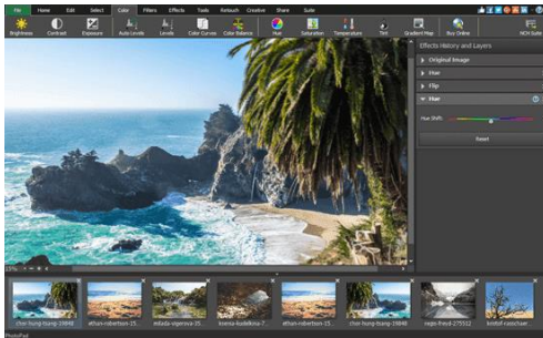
Fig. 1: Modifica a tu gusto tus fotos e imágenes