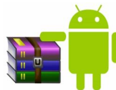
Fig. 4: También hay WinRAR para Android.

La última versión de WinRAR se hizo en el 2022, así que está muy actualizado. Puedes consultar las novedades en www.win-rar.com/upgradewinrar.html