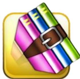
Fig. 1: Se instala WinRAR en Windows 10 y 11.

Con WinRAR puedes hacer las transferencias de archivos que quieras al instante, de una manera eficaz y segura, pues su transmisión por correo electrónico es rápida y organiza muy bien el almacenamiento de datos.